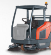
Sweepmaster 1500 RH do 14 580 m 2 /h