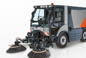
Citymaster 2200 System dwuszczotkowy