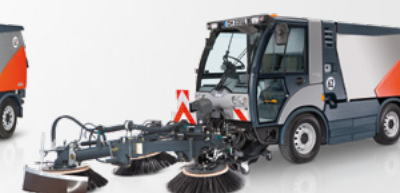
Citymaster 2200 System trójzczotkowy