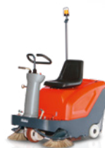
Sweepmaster B800 R do 6 660 m 2 /h