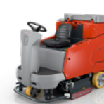
Scrubmaster B260 R do 8 600 m 2 /h