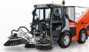
Citymaster 1650 System trójszczotkowy