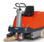
Sweepmaster 900 R do 7 200 m 2 /h