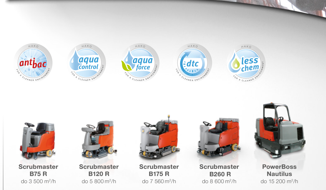
Szorowarki z operatorem siedzącym