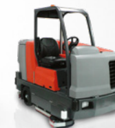
PowerBoss Nautilus do 15 200 m 2 /h