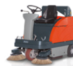
Sweepmaster 980 R do 7 200 m 2 /h