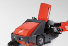
PowerBoss Armadillo 9XR do 25 100 m 2 /h