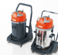
Cleanserv VL2-70, VL3-70 I