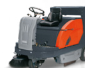
Sweepmaster 1200 RH do 13 200 m 2 /h