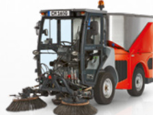
Citymaster 1650 System dwuszczotkowy