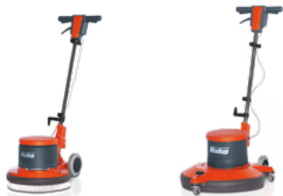
Cleanserv SD43/180, SD43/450 SD43/2 Speed

W wielu wypadkach odkurzanie jest najprostszym i najlepszym rozwiązaniem. Dostarczamy produkty idealnie dopasowane do potrzeb klienta – od odkurzaczy szczotkowych, przez odkurzacze do czyszczenia dywanów na sucho i mokro, aż do mocnych odkurzaczy przemysłowych.