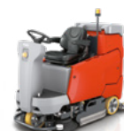
Scrubmaster B175 R do 7 560 m 2 /h